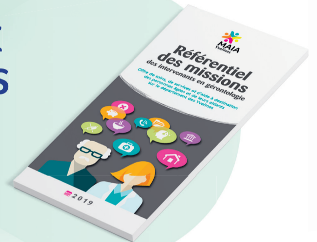
Référentiel des missions