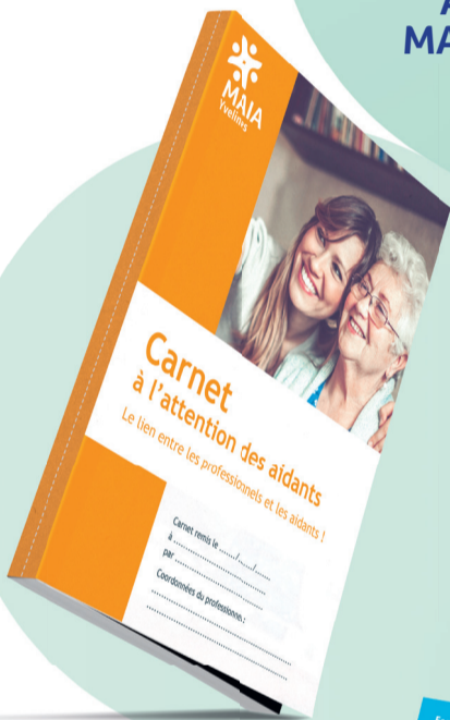
Carnet des aidants